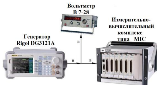
Рис. 2. Структурная схема калибровки измерительно-вычислительного комплекса типа МІС

Бюджет неопределенности измерений при калибровке измерительно-вычислительного комплекса типа МІС для значения напряжения 3,5 В приведен в табл. 2.