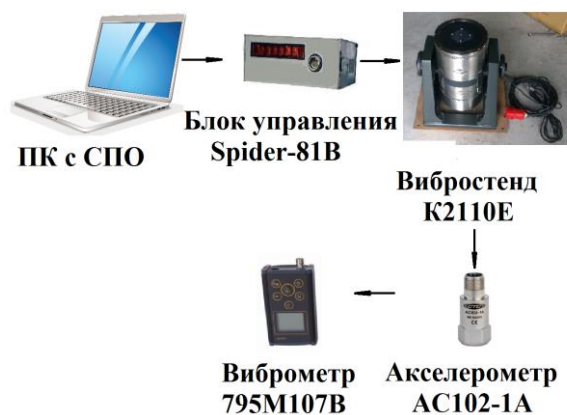
Рис. 1. Структурная схема калибровки виброметра в комплекте с акселерометром: ПК – персональный компьютер; СПО – специальное программное обеспечение

Структурные схемы калибровки указанных средств измерительной техники приведены на рис. 1 – 3 соответственно.