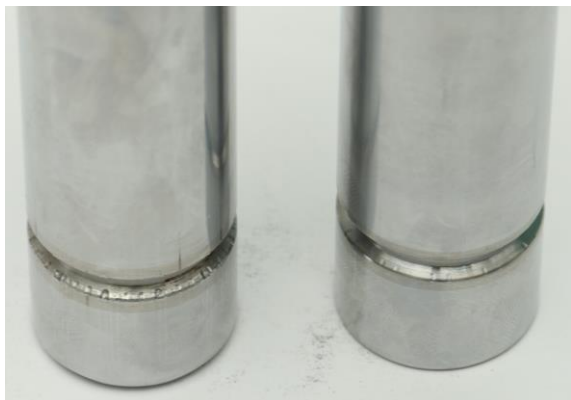
Рис. 2. Места контакта штока с шариками ФСП после нагружения 3000 кгс (штатный поршень – слева, поршень из стали 18ХГТ – справа)

– при нагрузке 3000 кгс штатный шток с поршнем потерял свою работоспособность, так как произошло стопорение запорной втулки и закусывание штока (рис. 2).