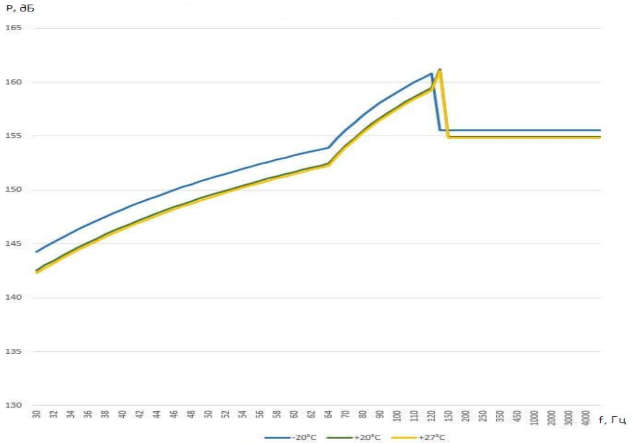
Рис. 1. График изменения звукового давления в зависимости от частоты вблизи зоны полезного груза