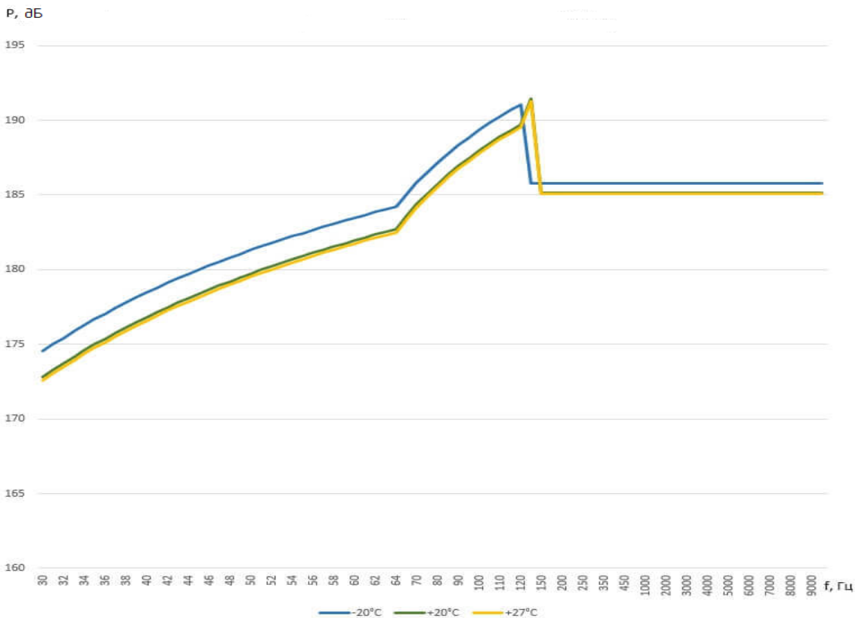
Рис. 4. Графики изменения звукового давления в зависимости от частоты вблизи хвостового отсека