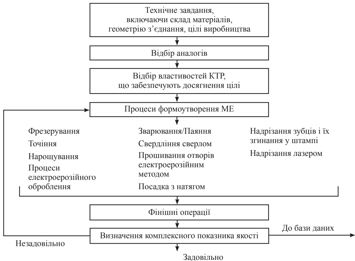
Рис. 2. Склад технологічних процесів виготовлення різних варіантів КТР

Послідовність дій при ТПВ і склад технологічних процесів виготовлення різних варіантів КТР показано на рис. 2.